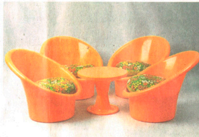
Einst revolutionär, heute weltweites Volksgut: die Kindermöbel-Serie Mammut (l.) und die Gartengarnitur Skopa.